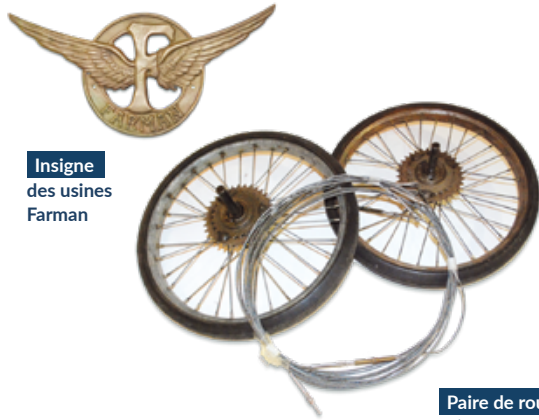
Insigne des usines Farman