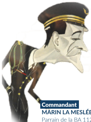
Commandant MARIN LA MESLÉE Parrain de la BA 112

Mise en service après trois ans de travaux sur un terrain ravagé par la guerre de tranchées, la BA 112 fut avant la guerre de 39-45, le lieu de stationnement d'unités dédiées au bombardement, à l'expérimentation, à la chasse, à l'observation et au parachutisme. En 1939, 1800 personnes y travaillaient et près de 300 avions y stationnaient.