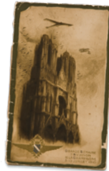
Le programme de 1910

A ce premier meeting aérien international de l'histoire, organisé avec le concours de grandes maisons de champagne, participent les sommités de l'aviation d'alors : Henri Farman, Louis Blériot, Hubert Latham, Glenn Curtiss, Louis Paulhan... D'autres meetings suivront de 1910 à 1913.