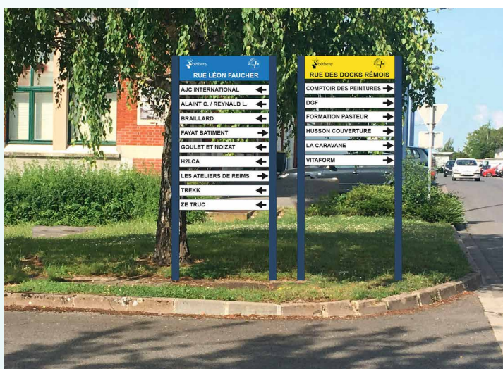
Simulation de la signalétique.

Sans tourner le dos au passé, la refonte de la signalétique et le développement des relations entre les entreprises donnent un nouveau souffle aux Docks rémois.